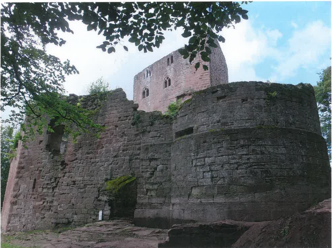
Fig. 27 Nouveau-Windstein - Barbacane

- Les équipements touristiques installés en 2015 ont été officiellement inaugurés le 24 avril 2016. en présence de Frédéric Reiss, député de la circonscription de Wissembourg, de madame Marajo-Guthmuller et mon-