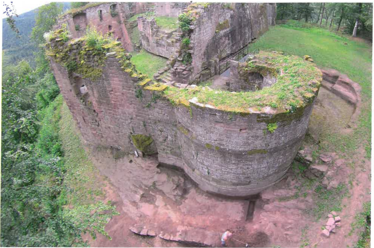
Fig. 28 Nouveau-Windstein - Vue aérienne de la barbacane