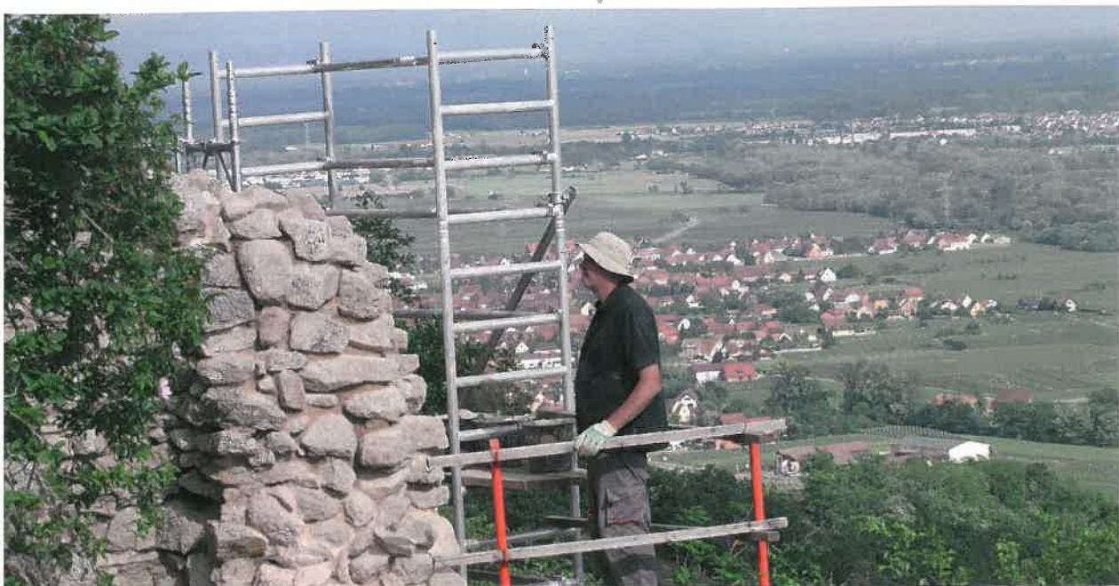
Fig. 30 Ramstein - Travaux de consolidation sur la tourelle sud

sieur Bertrand, conseillers départementaux, de messieurs Walther, conseiller régional et Feig président de la communauté de communes du Pays de Niederbronn-les-Bains. Près de 90 personnes étaient présentes lors de cette fraîche matinée (même froide, 3°C à peine), mais ensoleillée. Les « légères » giboulées de neige n'ont pas altéré la bonne humeur qui marquera les annales de la commune et l'histoire du Nouveau-Windstein !