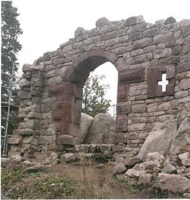
Fig. 26 Kagenfels - Porte PA après remontage, vue de l'extérieur

lement servi de tour défensive creuse au-devant du pailier du logis, puis de citerne à filtration, après réalisation d'une solide voûte maçonnée en intérieur de la tour (nommée TP sur les plans de localisation).